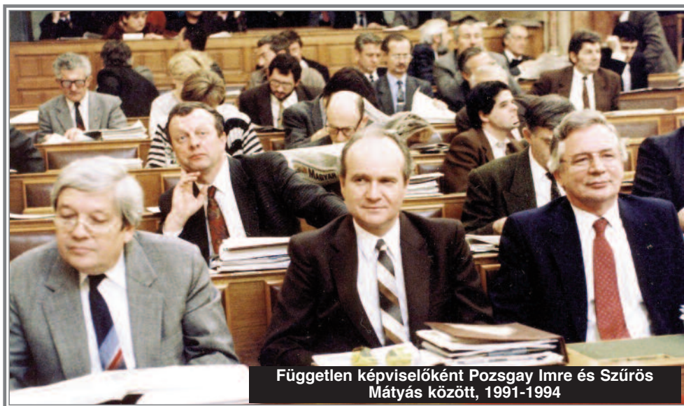
Független képviselőként Pozsgay Imre és Szűrös Mátyás között, 1991-1994