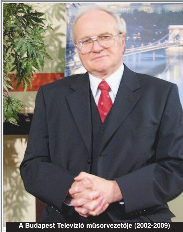
A Budapest Televízió műsorvezetője (2002-2009)